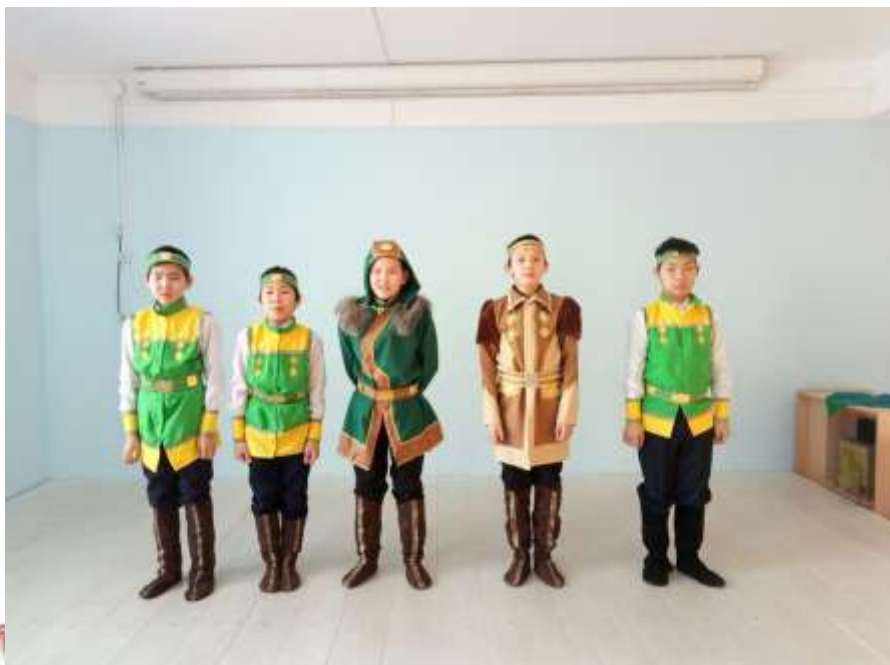
«ЧабырБахсыт оҕолор» күрэскэ 2 миэстэ